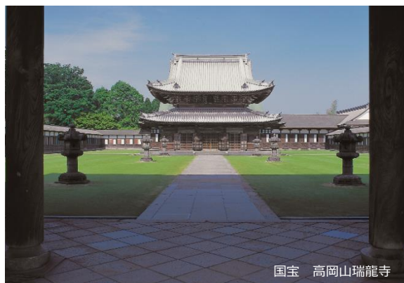
国宝 高岡山瑞龍寺

A 8 高岡市個人情報保護条例第 25 条の規定により、簡易開示請求を行うことができます。詳しくは、「募集要項」をご確認ください。