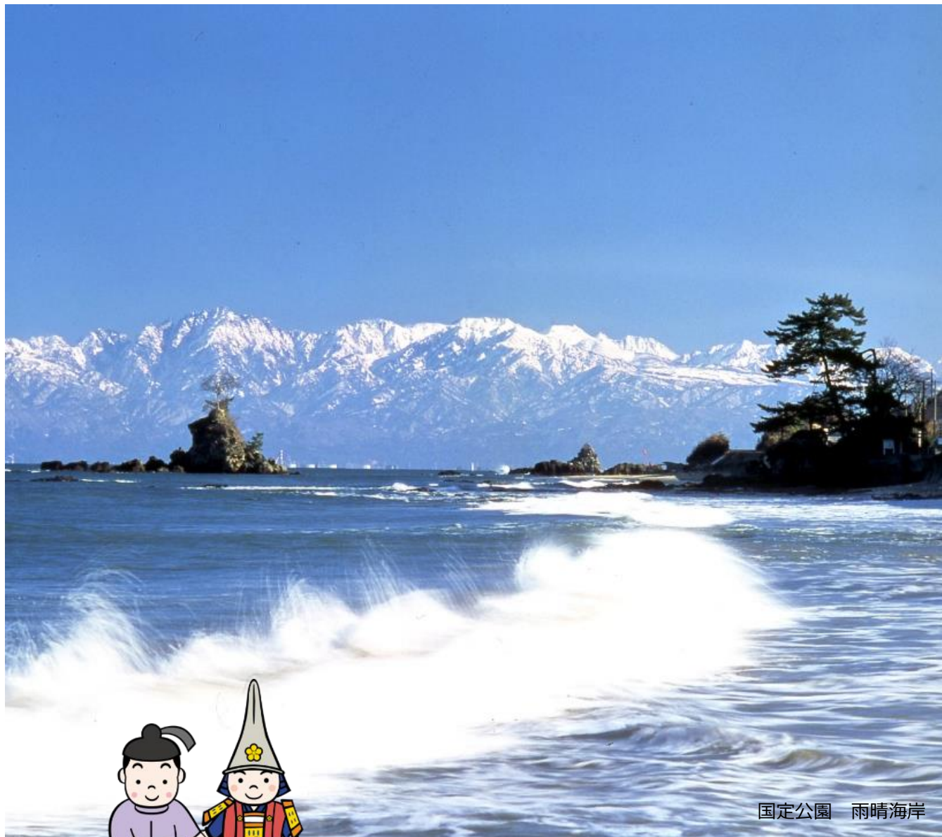
国定公園 雨晴海岸